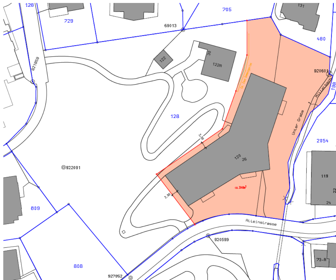
Abb. 2. Das Gebäude Alterszentrum Arosa und das Grundstück (rot), welche an die zu gründende Dachorganisation übertragen werden.

Obwohl durch die Eigentumsübertragung auf Seiten der Dachorganisation kein Gewinn generiert wird, löst die Eigentumsübertragung doch ein buchhalterisches Problem, das alle drei Organisationen betrifft, die in der ersten Phase in der Dachorganisation zusammengeführt werden sollen. Sie haben alle ein unzureichendes Anlagevermögen. So ist z.B. das Anlagevermögen der Stiftung Alterszentrum Arosa aufgrund des Verkaufs der Liegenschaft Surlej so tief, dass sie bei einem Defizit in der Jahresrechnung auf eine Defizitdeckung der Gemeinde angewiesen ist, um nicht sofort in eine Überschuldung zu laufen und Konkurs anmelden zu müssen. Für das Alterszentrum Arosa hat die Eigentumsübertragung einen weiteren wichtigen Vorteil. Das Alterszentrum verfügt nämlich heute am Jahresende jeweils über liquide Mittel von ca. CHF 1 Mio., die sie aber heute aus finanztechnischen Gründen nicht verwenden darf. Die Mittel stammen aus den Beiträgen der Bewohner an den Instandsetzungs- und Erneuerungsfonds und sind in der Bilanz nicht nur auf der Aktivseite, sondern als Rückstellung auch auf der Passivseite verbucht. Durch die Übertragung der Liegenschaft an die